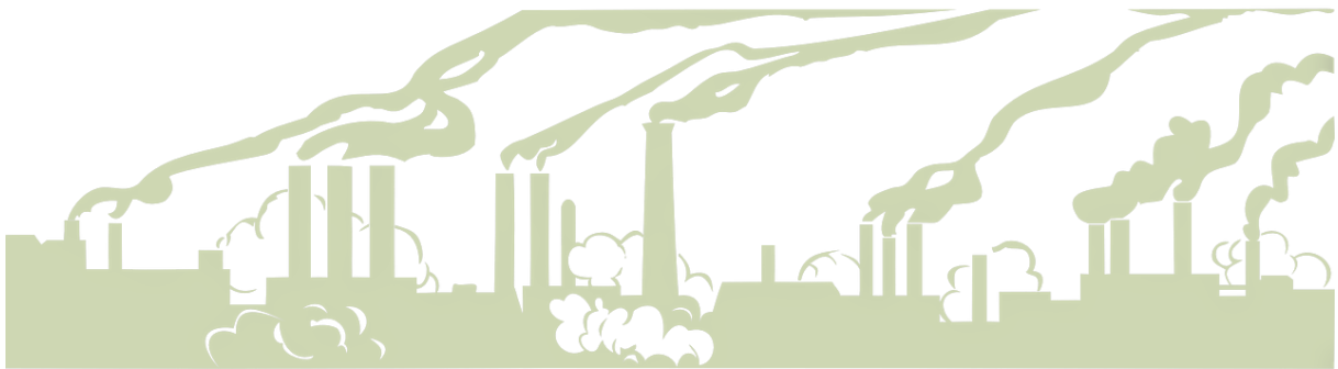
ecology-158945_1280.png

RAPPORT D'EXPERTS RÉALISÉ SUR MANDAT DE L'OFFICE FÉDÉRAL DE L'ENVIRONNEMENT (OFEV)